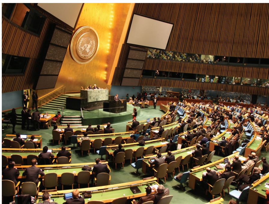
联合国大会对武器贸易条约投票当天。2013年4月

10月11日，联合国第一委员会通过一项决议草案，支持武器贸易条约的实施。草案呼吁所有尚未通过该条约的国家签署和批准条约，并呼吁有能力的国家提供法律或立法支持、机构能力建设，以及技术、物资或